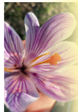
Deze foto's zijn afkomstig uit de serie 'Kijk onze Wijk', gemaakt door jongeren uit Overstegen. Alle foto's zijn te zien in De Daele.